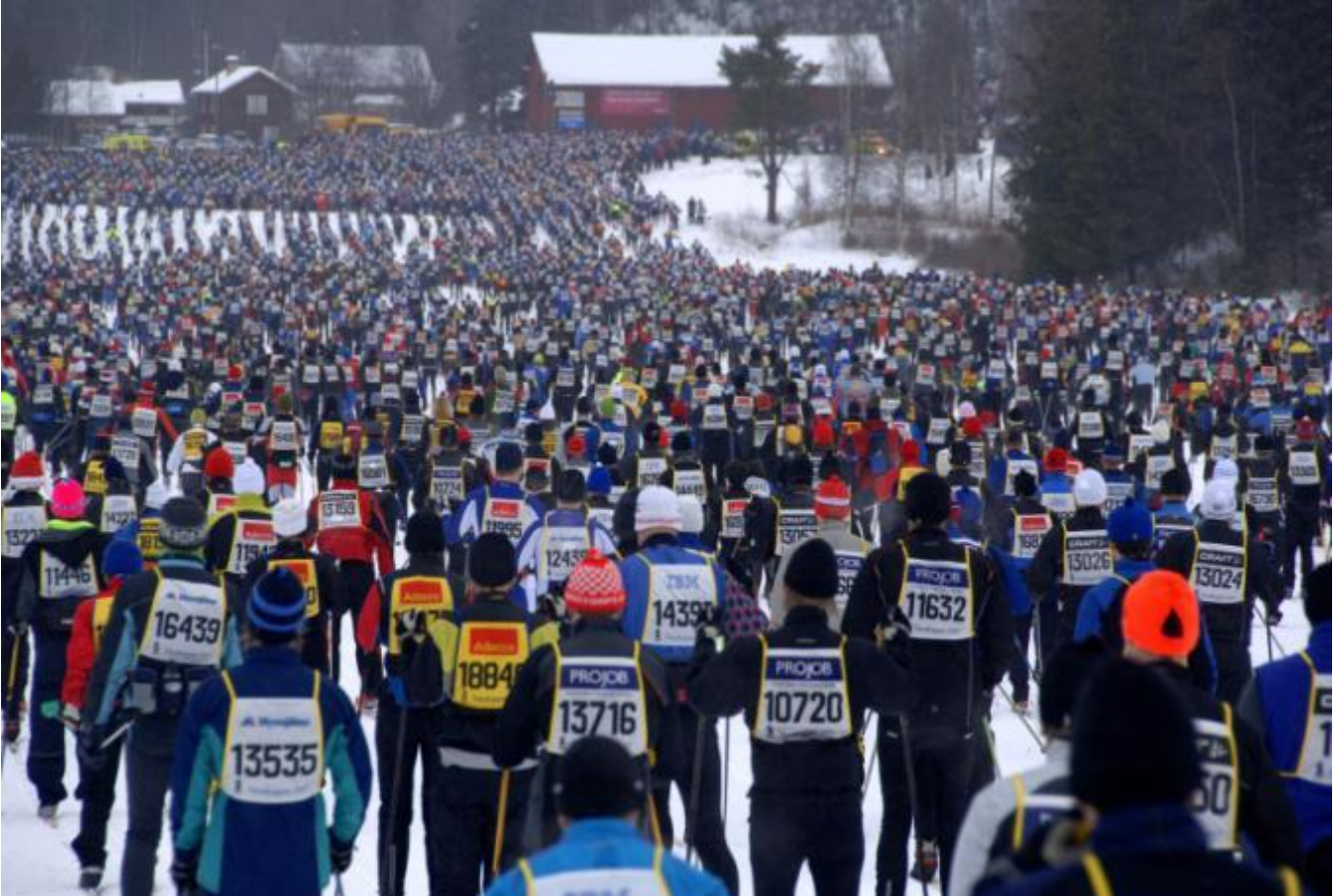
Vasaloppet Klassisk bild från vägövergången, Berga by, Sälen.