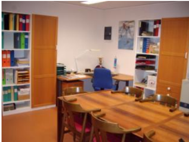
Som synes, ett obemannat kansli. Skatås.