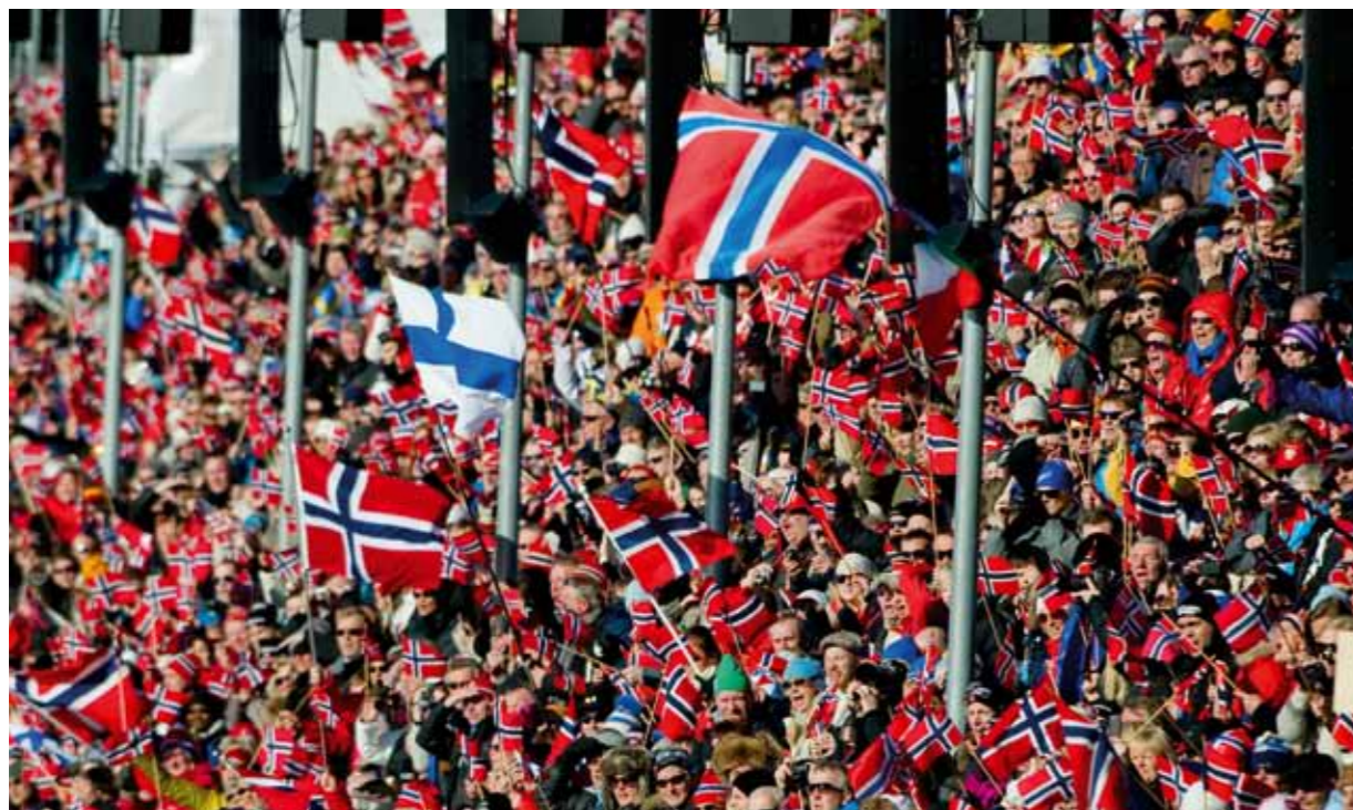
Stor publikfest under VM i Oslo i februari 2010. För Falun är alla inställda på att göra ett VM som överträffar alla förväntningar.