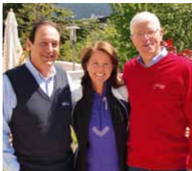
Cheferna för VM i Oslo, Val di Fiemme och Falun samlade.

svensk skidsport och Svenska Skidförbundet gör en tydlig satsning mot 2015.