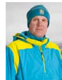
Tomas Carlqvist FÖRBUNDSKAPTEN FREESTYLE PUCKELPIST